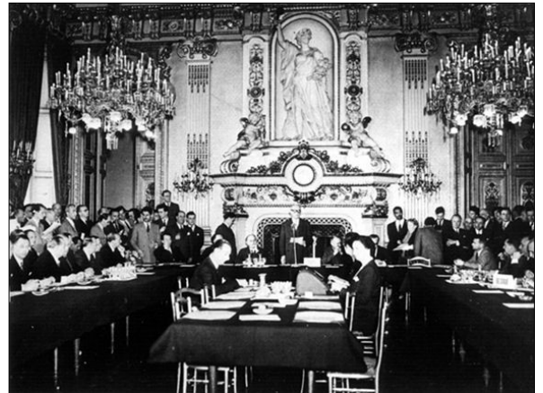
Objavljivanje Deklaracije u Sali sa satom francuskog Ministarstva spoljnih poslova

Proizvodnja bez pravljenja razlika i isključivanja će služiti celom svetu radi po-